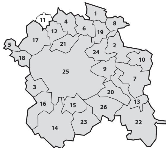
Region Winterthur und Umgebung (RWU)