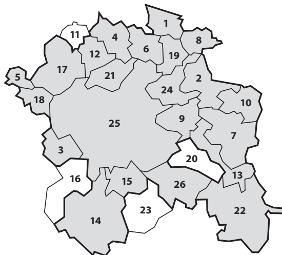
Standortförderung Region Winterthur